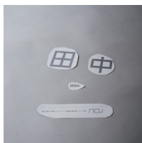
岡山を拠点に活動する グラフィックデザイナー・田中雄一郎と 写真家・田中園子が語る 最小級マガジン「田中」刊行